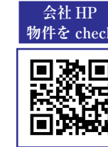
会社 HP 物件を check