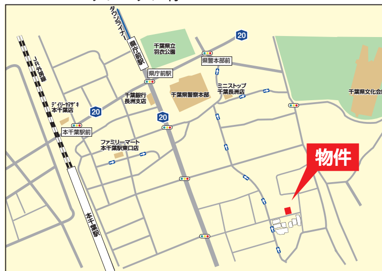
Googleナビ入力 千葉市中央区長洲2丁目12-30付近 物件案内図